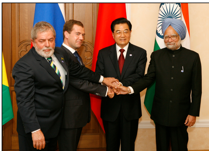
Document 5 : Le sommet des BRIC de Ekaterinbourg (Russie), le 16 juin 2009, Rue89.

C'est un événement hautement symbolique des nouveaux rapports de force internationaux : [...] Mardi, à Ekaterinbourg, en Russie, les dirigeants des quatre plus grandes économies dites « émergentes » Brésil, Russie, Inde et Chine se sont réunis pour discuter des affaires du monde, entre eux, sans les Occidentaux. L'événement n'aurait pas eu grand sens il y a seulement dix ans [...] mais les Bric ont pris de l'assurance, et souhaitent que leur voix porte plus sur les affaires économiques internationales. Surtout quand la crise économique et financière est provoquée par celui qui en détenait jusqu'ici tous les verrous : les Etats-Unis.