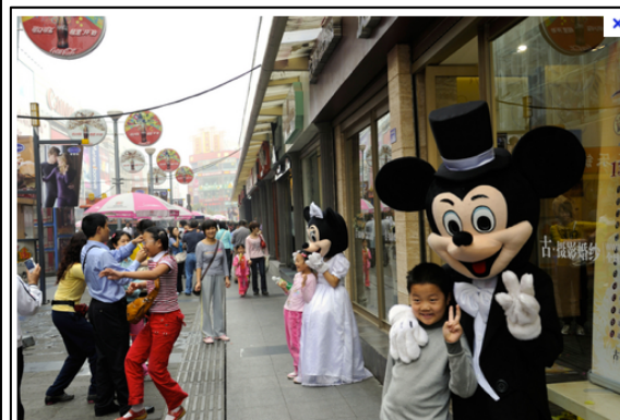
Document 4 : La puissance culturelle. Mickey Mouse et Coca-Cola, deux vecteurs de la culture américaine en Chine, à Chengdu.